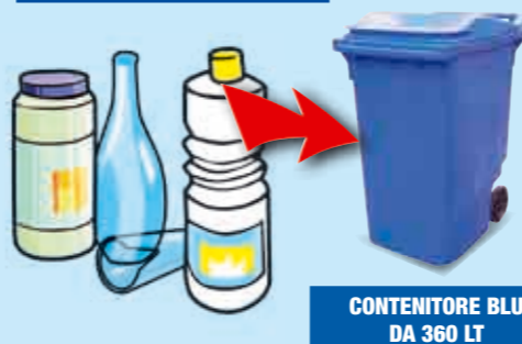
CONTENITORE BLU DA 360 LT