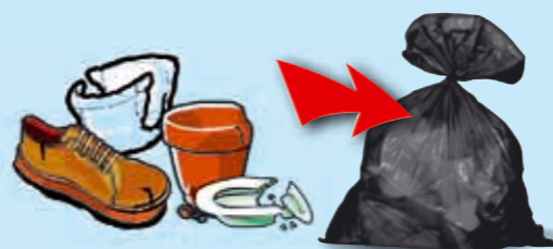
SACCHETTO DA PATTUMIERA O BUSTE DELLA SPESA