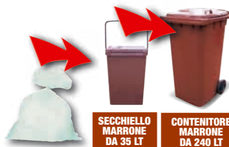
SECCHIELLO MARRONE DA 35 LT CONTENITORE MARRONE DA 240 LT